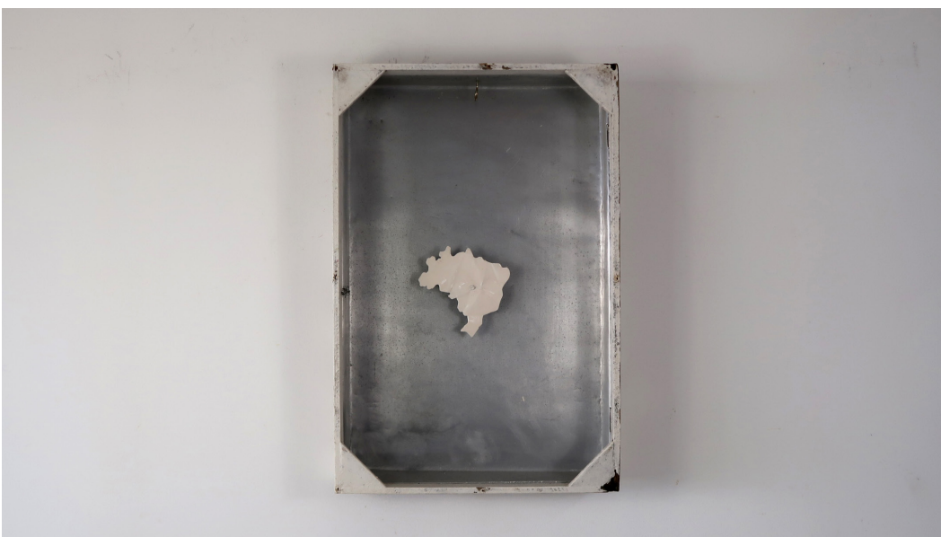
FIGS. 4-5. – Emmanuel Nassar, TrapiocaBox , 2021. Pintura sobre madeira e chapa metálica 67x45x11,5 cm.