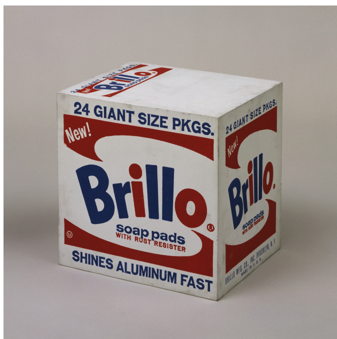
FIG. 6. Andy Warhol, Brillo Box (Soap Pads) , 1964. Serigrafia e pintura em tinta sintética de polímero sobre madeira, 43,3x43,2x36,5 cm.

Amazônia. Regionaliza o objeto, saindo da escala industrial dos sabões em pó estadunidenses a que Warhol se remete, partindo para um consumo artesanal de tapiocas, produzidas de forma caseira e ancestral, em que nem as embalagens nem os produtos seguem um padrão estandardizado. Warhol, ao remeter-se à problemática do consumo, dirige-se diretamente à cultura industrial e publicitária estadunidense dos anos 1960; enquanto Nassar, além de tratar desses assuntos em uma realidade amazônica, também denuncia problemas socioambientais da Amazônia atual 9 .