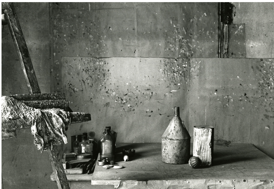
FIG. 3. Paolo Monti, Servizio fotografico (Bologna, 1981) [Ateliê de Giorgio Morandi] , 1981. Fotografia em gelatina sobre prata, 24x30cm. Fonte: Acervo Biblioteca Europea di Informazione e Cultura (número de inventário BEIC 6341001).