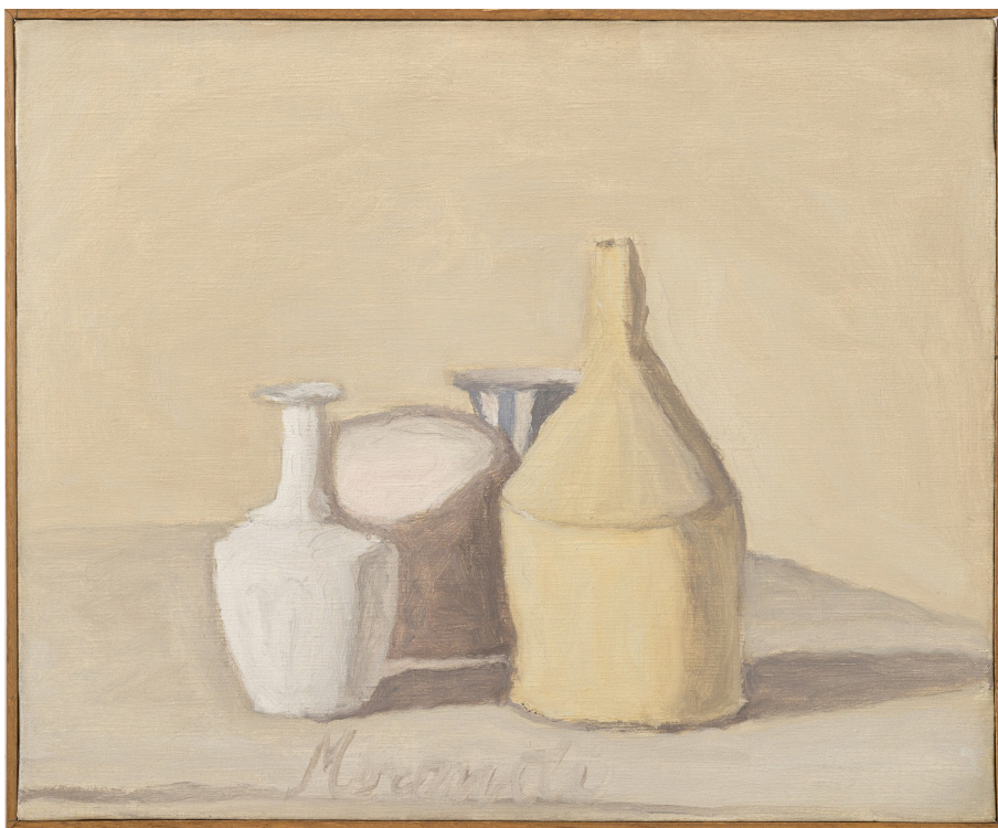
FIG. 2. Giorgio Morandi, Natura morta , 1948. Óleo sobre tela, 30,7x37cm.