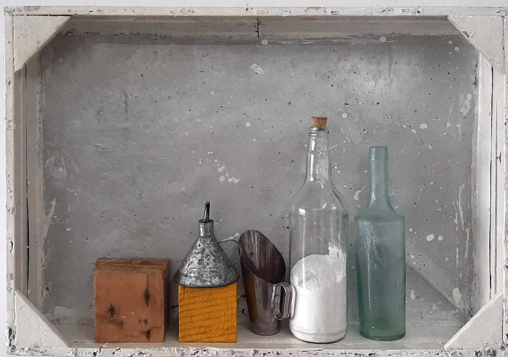
FIG. 1. Emmanuel Nassar, Morandi Nassar , 2021. Pintura sobre madeira, chapa metálica, madeira, objetos em metal e vidro, gesso em pó e rolha de cortiça, 67x45x11 cm.

madeira – este pintado em amarelo puro, uma das cores características do trabalho de Nassar, juntamente com as duas outras cores primárias –; um copo medidor de farinha de mandioca, amplamente usado nos mercados de Belém; uma garrafa vazia de bebida, cheia de pó de gesso e tampada com uma rolha de cortiça, e uma garrafa ornamental. Tudo isso é posto na frente de uma chapa metálica reutilizada da construção civil, que compõe o fundo da obra. O artista, em tom bem-humorado, indaga sobre a representação de objetos e a possibilidade de usar os próprios em si, como uma mimesis platônica reversa, incentivada pelo ready-made .