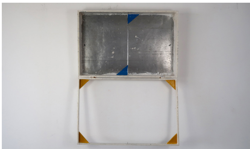
FIGS. 8-9. Emmanuel Nassar, Trapiocazem1 , 2021, pintura sobre madeira e chapa metálica, 45x67x11 cm (fechado) e 90x67x11 (aberto).